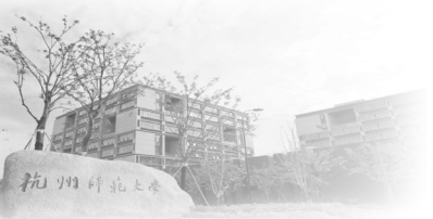
附件 2: 杭州师范大学本科生学科竞赛获奖奖励标准一览表